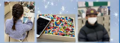
♡締切の戦 ♡アート素材 ♡かっちょいへね