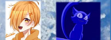
♡Yさんpart3 ♡ジジじゃない♡ ♡デザイン K