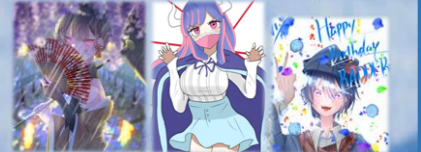
♡Yさん新作! ♡大型新人初作 ♡Yさんpart2