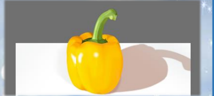
♡デジタル模写。写真みたいK