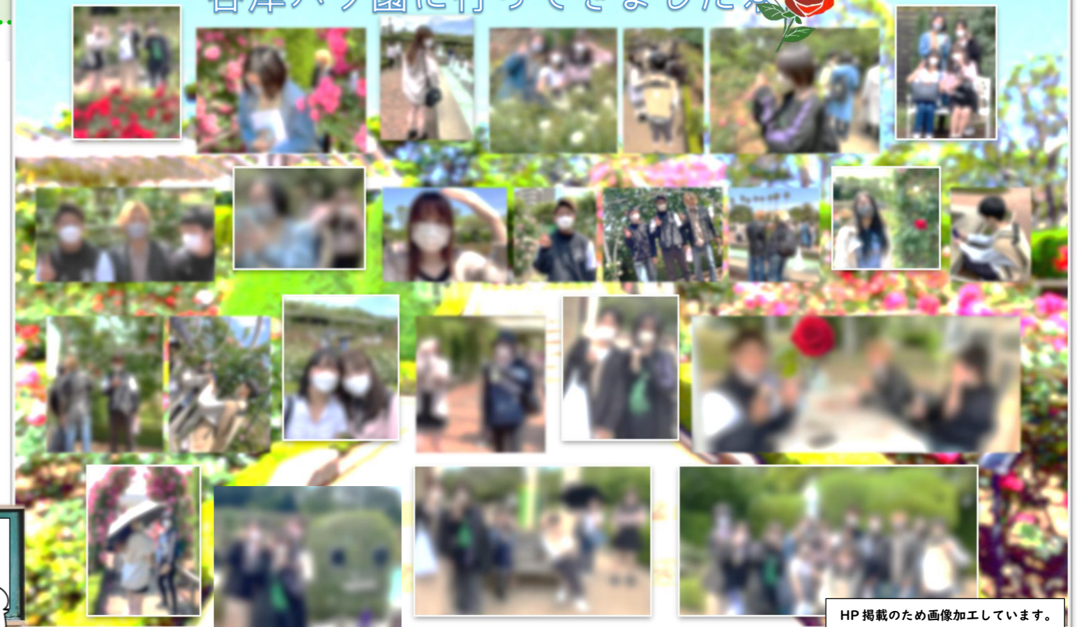
HP掲載のため画像加工しています。